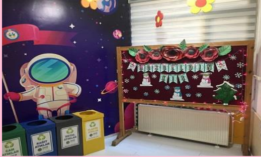
Veli Görüşme Salonu